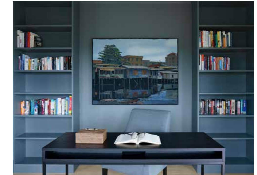
Vegg: Gjoco Supermatt, 371 Skyggespill. Innredning Gjoco Fashion 05, 371 Skyggespill.

Glansgradene angir hvor blank malingen er på en skala fra 0 til 100, der 100 er den blankeste. Hvor blank maling du bør bruke vil bli en avveining mellom praktisk eller pent. Med blank maling vil ujevnheter i flaten vises tydeligere, og underlaget krever bedre grunnarbeid, men samtidig er blanke overflater mer slitesterke og lettere å holde rene. Matt maling skjuler ujevnheter i underlaget, og gir et perfekt, eksklusivt og tidsriktig sluttresultat. For øvrig setter skitt og støv seg lettere i en helmatt maling, og det er derfor ikke å anbefale å bruke helmatt maling til kjøkken og bad.