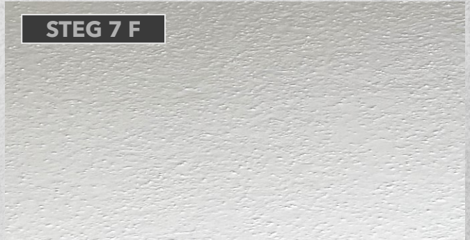
STEG 7 F

Når man har påført og fordelt Ekstrem på hele gulvet, rulles det over med bred rulle for optimal finish