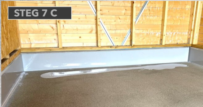
STEG 7 C

HVORDAN MALE MED ANTISKLI EPOXY I GARASJEN ?