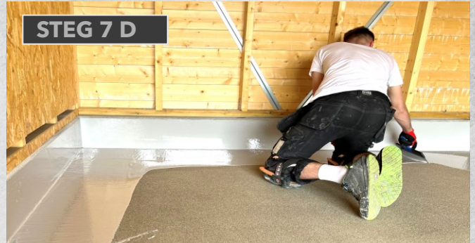
STEG 7 D

Hell ferdig blandet Ekstrem ut på gulvet på et mindre område om gangen og gå til neste steg