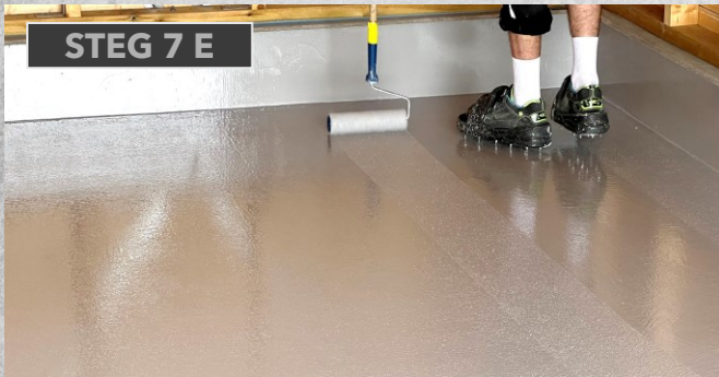
STEG 7 E

Når påført på mindre felt, bruk en bred sparkelspade for å fjerne overskytende Epoxy og «hjelpe» den ut til kantene.